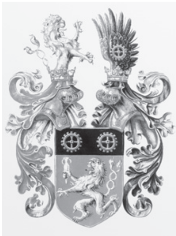
Wilhelm Kralik Ritter von Meyrswalden - erb

kostí!!!) Josef Taschek se narodil v roce 1814 v rodině českobudějovického obchodníka se sklem Tascheka.