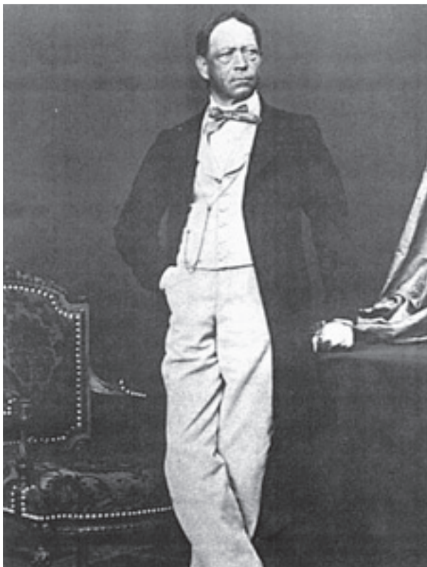
Wilhelm Kralik Ritter von Meyrswalden - cca. 1876