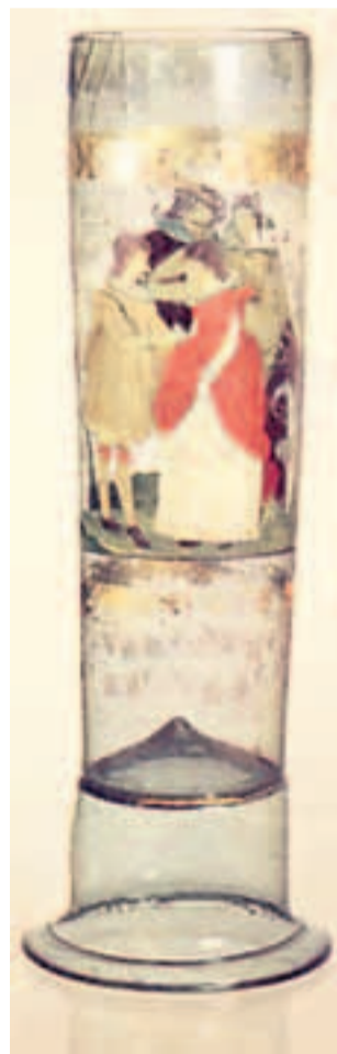
RENERANCE Zdobilo se barevnými emaily a zlatem