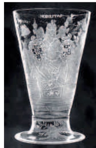
CASPAR LEHMANN Průkopník rytých pohárů, ital, který pracoval v rudolfínské Praze

né tajemstvím. Přispěl i novoborský „sklářský mág“ Bedřich Egermann, který v první čtvrtině 19. století experimentoval se skly napodobujícími polodrahokamy. A další a další... Oživení českého skla se podařilo, což potvrdila nastupující secese i slohy, které přišly po ní.