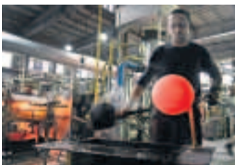
PRO JAPONCE Foukání lustrů ve sklárně Janštejn. Putují do Japonska.

vynikajícím školstvím, mezinárodní pověst a české sklo znovu získalo solidní světovou pozici. Od poloviny 19. století sbíralo na světových výstavách ceny, v roce 1893 je ocenila i Světová výstava v Chicagu, sedm let nato dokonce secesní sklo šumavské firmy Loetz doslova zazářilo tam, kde se secese zrodila – na Světové výstavě v Paříži získalo Grand Prix (mimořadně, právě je k vidění na výstavě v Kašperských Horách) A 20.