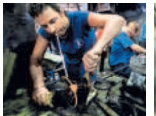
UNIKÁT Nejvyšší sklenici v Česku vyrobili v Harrachově