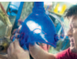
CENA Skláři ze sklárny v Lindavě vyrábějí cenu Thálie podle návrhu Bojka Šípka