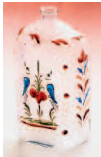
MALOVANÁ KARAFKA Kus z 18. století, sloužila našim předkům na rosolku