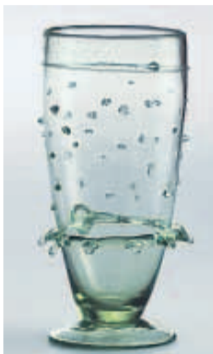
GOTIKA V „lesním“ skle vítězil perličkový dekor